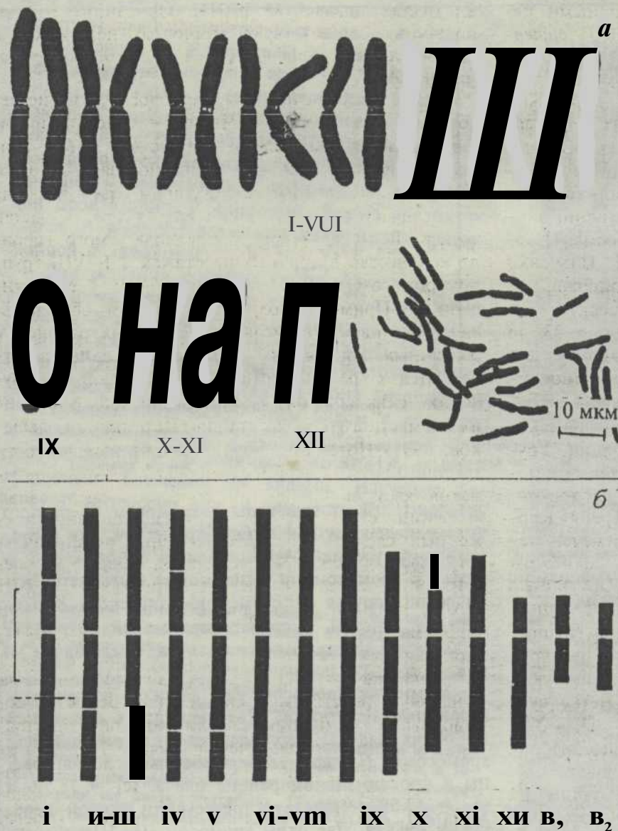
Рис. 3. Кариотип и идиограмма ели аянской.

a — кариотип, систематизированный по результатам поликариограммного анализа; б — идиограмма ели аянской; 1—XII — номера хромосом; масштабная линейка 5 мкм